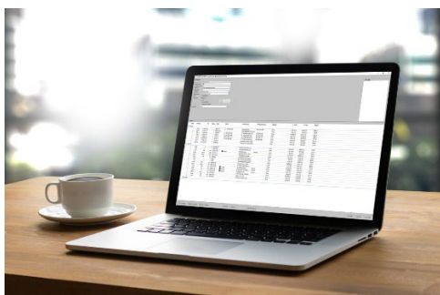
[Online Bestellwesen LogiKal]

Kromě vedoucího sortimentu systémových řešení na trhu firma heroal podporuje své partnery komplexními servisními službami a digitálními možnostmi, které přináší efektivitu, flexibilitu a přidanou hodnotu do všech fází stavebního projektu.